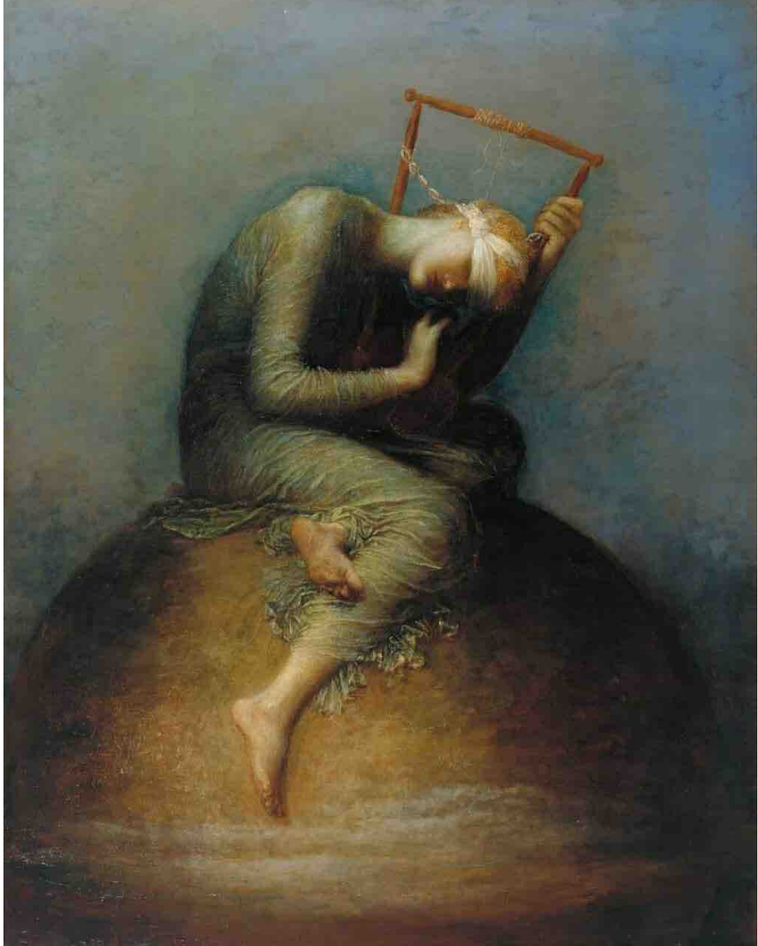
اسم اللوحة: George Frederic Watts