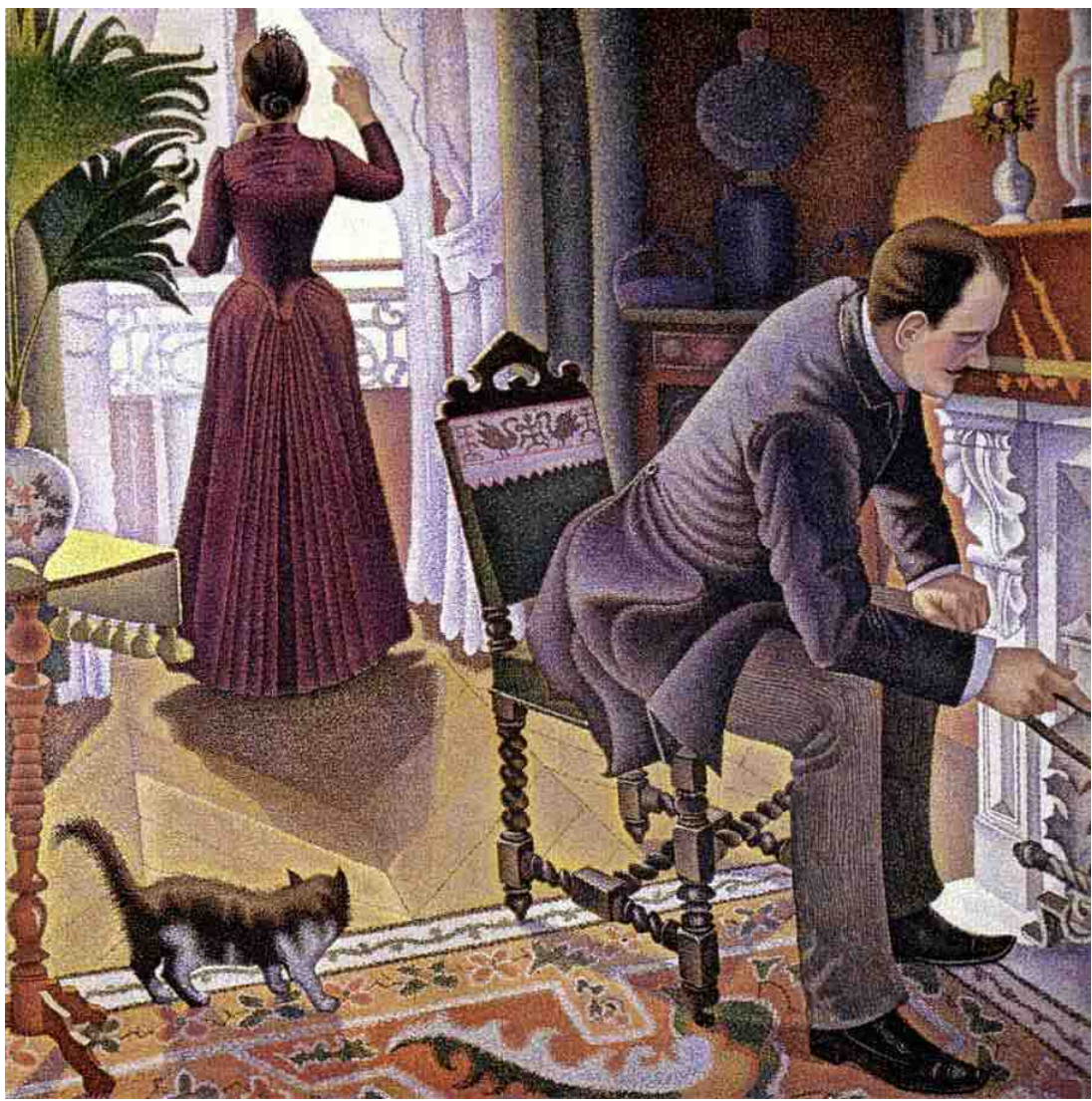
اسم اللوحة: Dimanche - Paul Signac