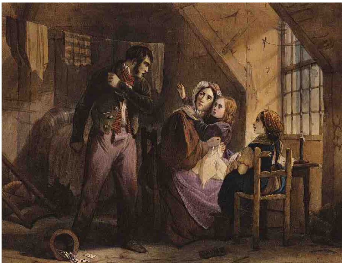
اسم الرسام: Jules David