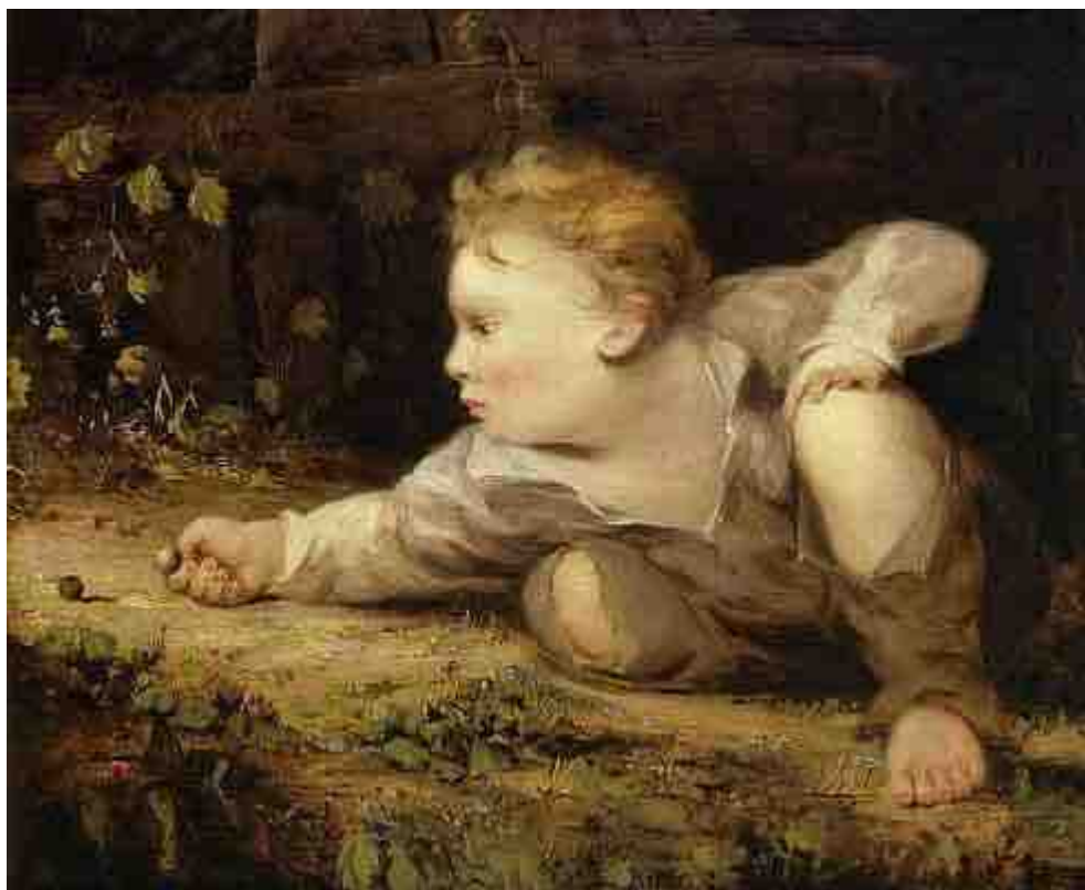
اسم الفنان: David Gilmour