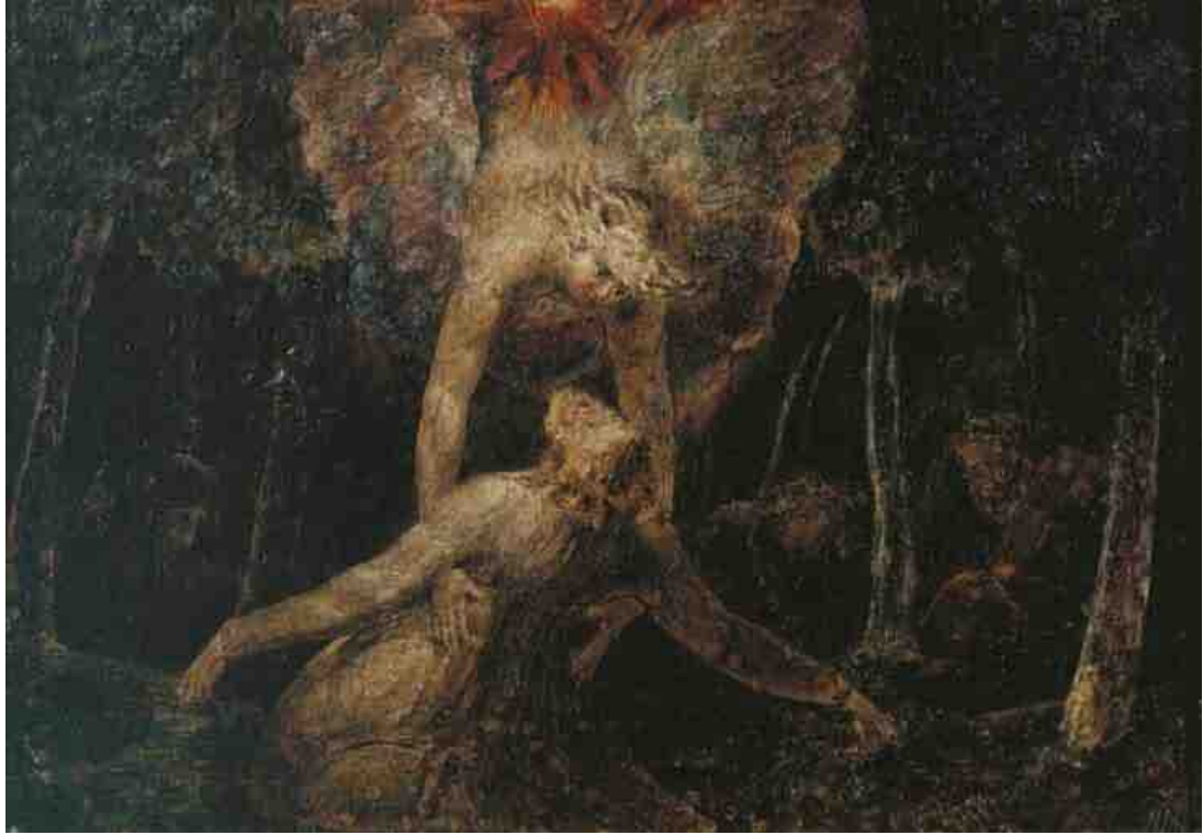
The Agony in the garden - William Blake: اسم اللوحة