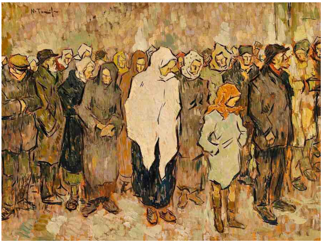
اسم اللوحة: Bread Line - Nicolae Tonitza