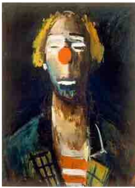
اسم الفنان: Joseph Kutter