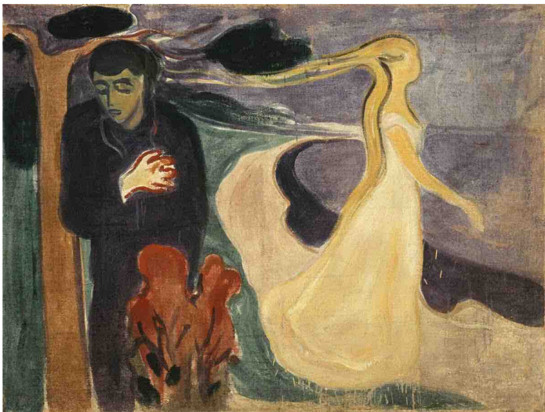
اسم اللوحة: Separation - Edvard Munch