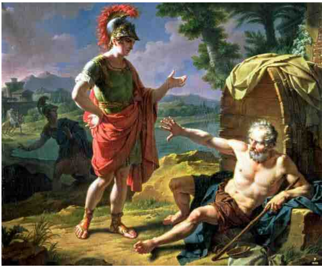
Monsiau- Alexandre et Diogene: اسم اللوحة