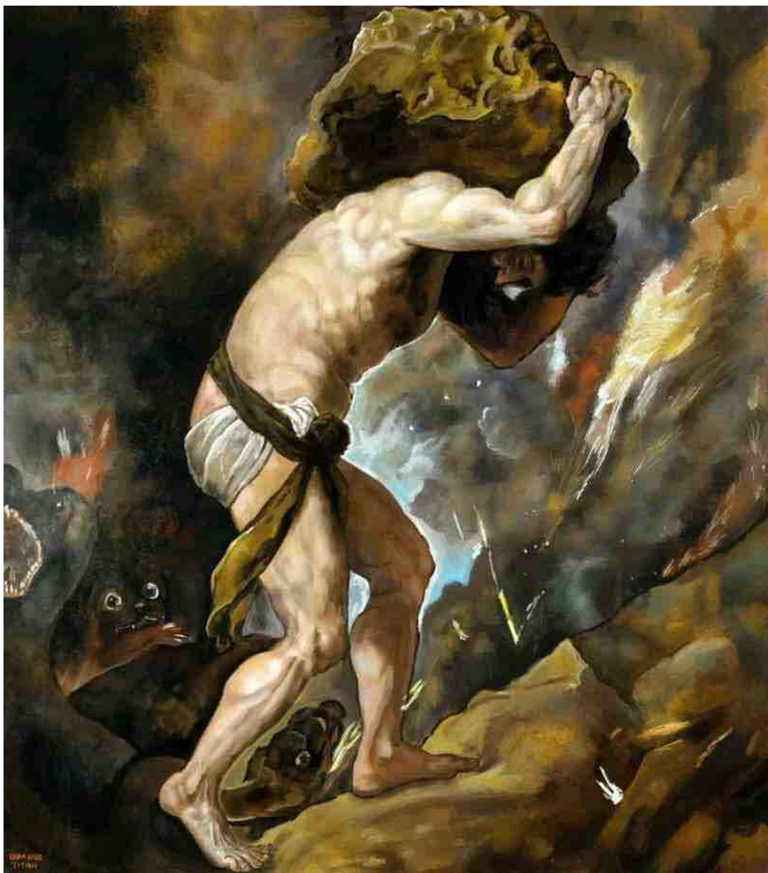
اسم اللوحة: Sisyphus Painting by Titian